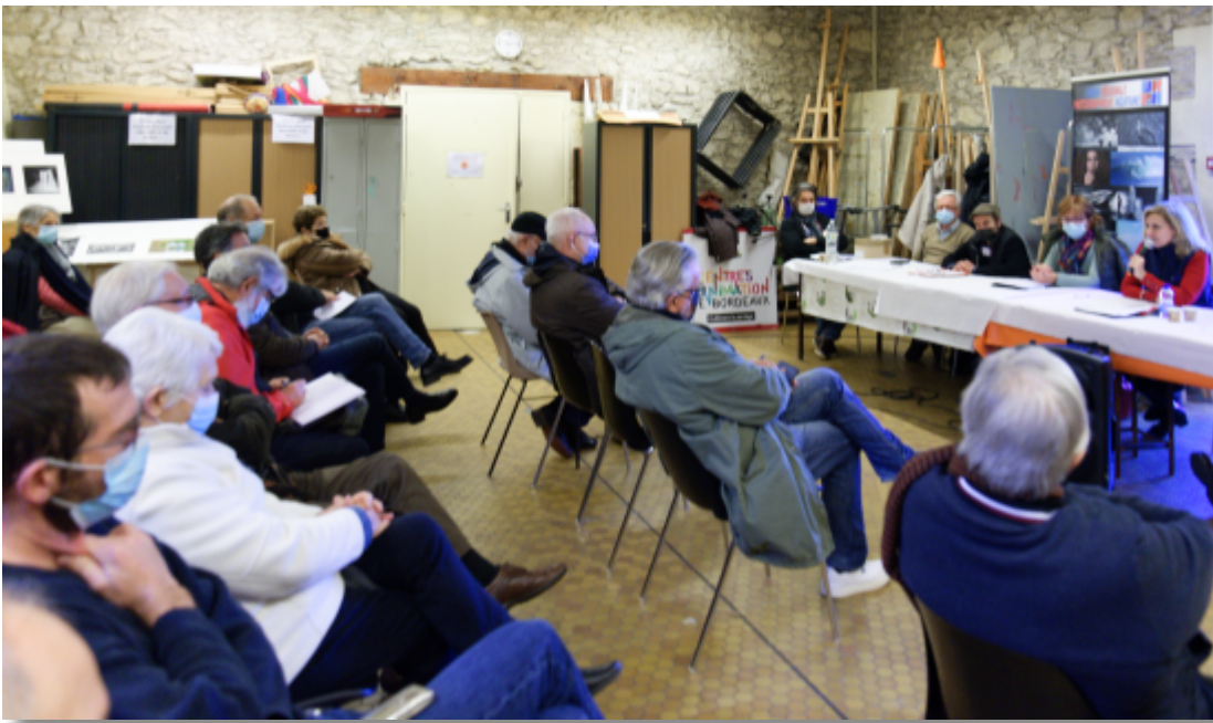
Pendant l'Assemblée Générale