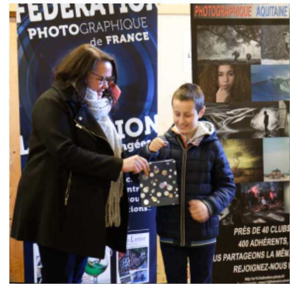
Remise du prix au gagnant du Concours Jeunes