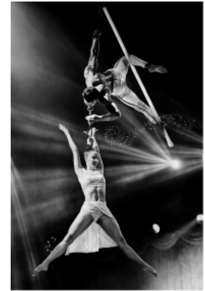
Sophie POUILLON " Où sont passés les cirques ? "