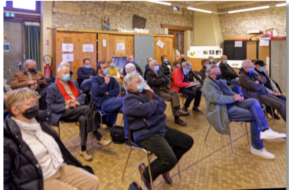
Pendant l'Assemblée Générale, le CA et l'assistance