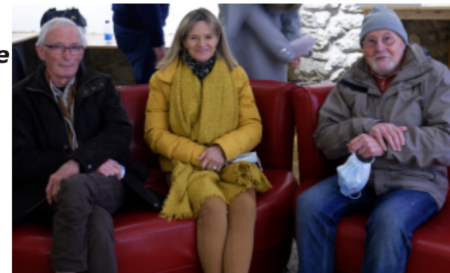
Les juges Nature