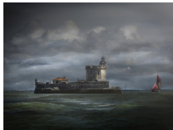
Gilles DE MORANGIES " Bords de mer "