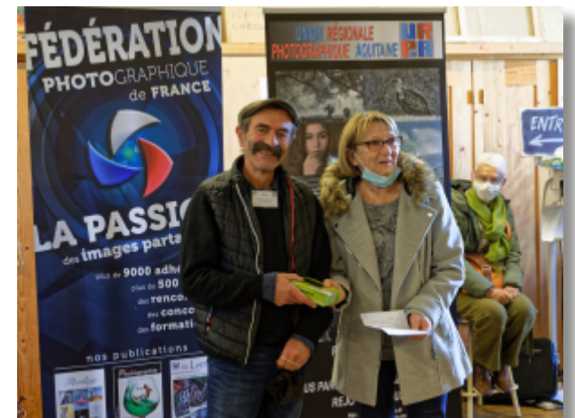
Remise d'un prix nature au Photo-Club Sarladais