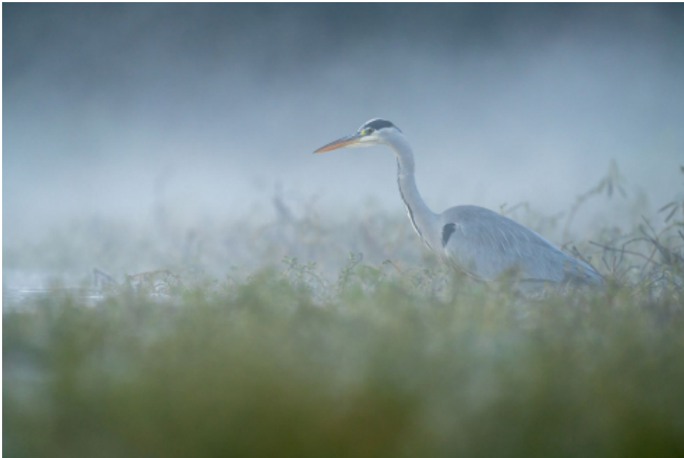
Régis PARRENS " Matin brumeux "