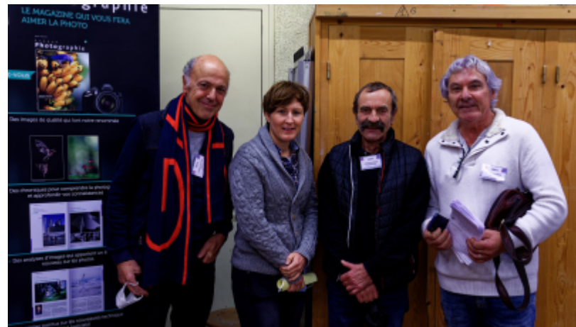
Le commissaire Auteurs et les juges